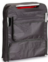
Transport- und Aufbewahrungstasche (Art. 19850)