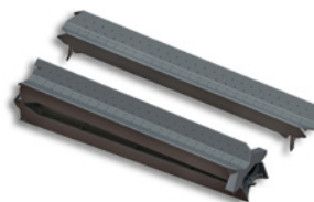
Auf- und Überfahrtschiene (faltbar) (Art. 19950)