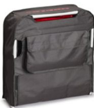
Transport- und Aufbewahrungstasche (Art. 19840)